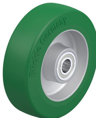
Roue utilisée ALST 125/15K