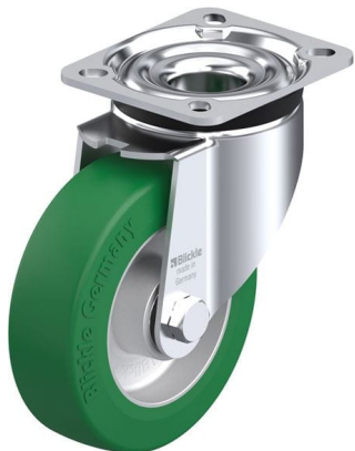
Roulette pivotante correspondante LK-ALST 125K-1