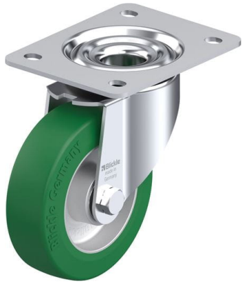
Roulette pivotante correspondante LK-ALST 125K-3