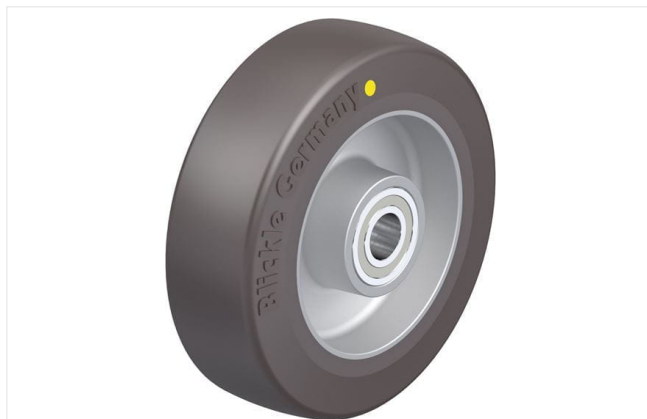
Roue utilisée ALST 125/15K-AS