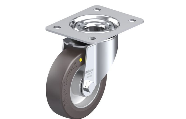
Roulette pivotante correspondante LK-ALST 125K-3-AS