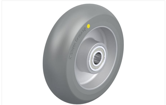
Roue utilisée ALTH 125/15K-AS-C0