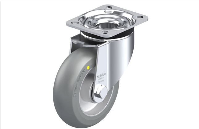
Roulette pivotante correspondante LK-ALTH 125K-1-AS-C0