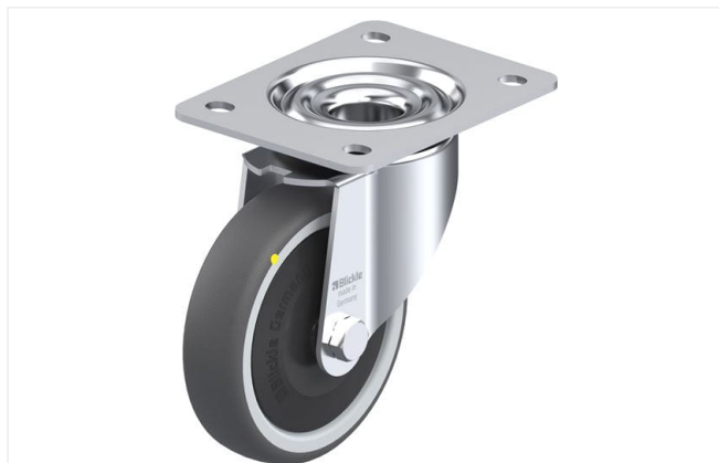
Roulette pivotante correspondante LK-PATH 125KF-3-ELS