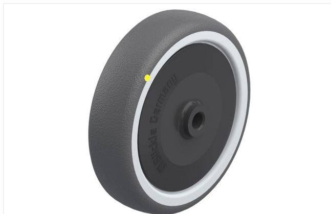
Roue utilisée PATH 125/10KF-ELS