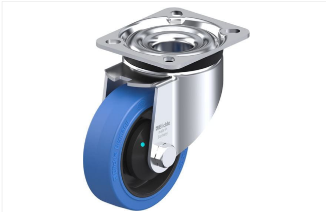
Roulette pivotante correspondante LK-POEV 100KAD-1-SB