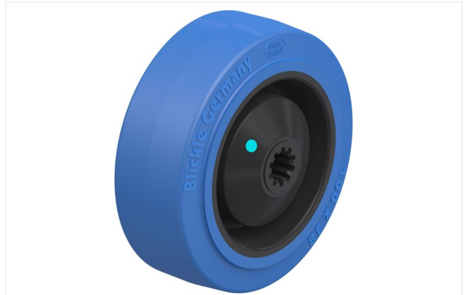
Roue utilisée POEV 100/10KAD-SB