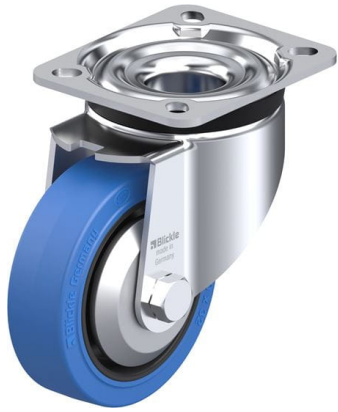
Roulette pivotante correspondante LK-POEV 100R-1-SB-FA