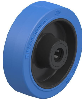
Roue utilisée POEV 100/15R-SB