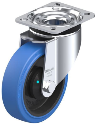
Roulette pivotante correspondante LK-POEV 125KAD-1-SB