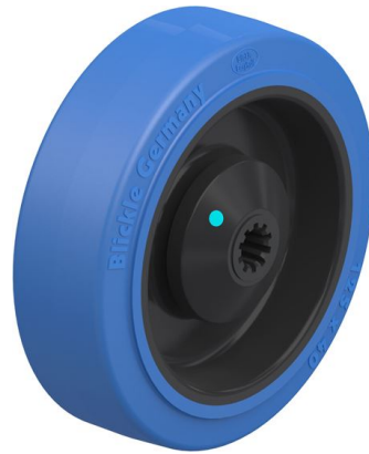
Roue utilisée POEV 125/10KAD-SB