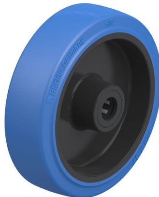
Roue utilisée POEV 125/15R-SB