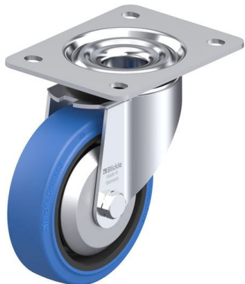
Roulette pivotante correspondante LK-POEV 125R-3-SB-FA