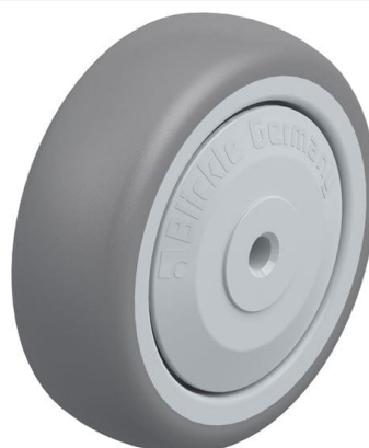
Roue utilisée TPA 75/6KF