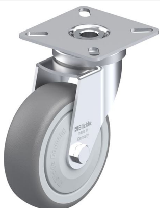
Roulette pivotante correspondante LPA-TPA 75KF