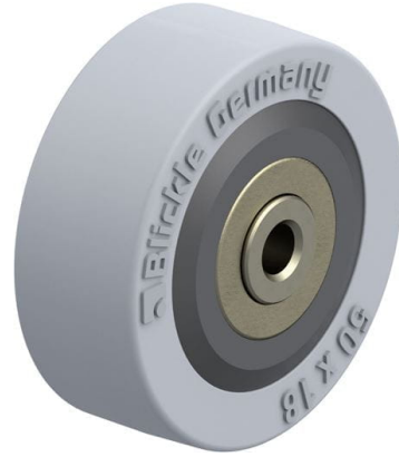
Roue utilisée VPA 50/6K