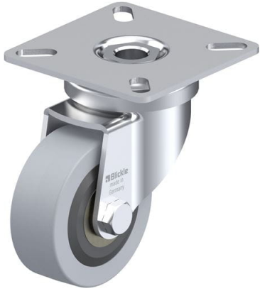
Roulette pivotante correspondante LPA-VPA 50K