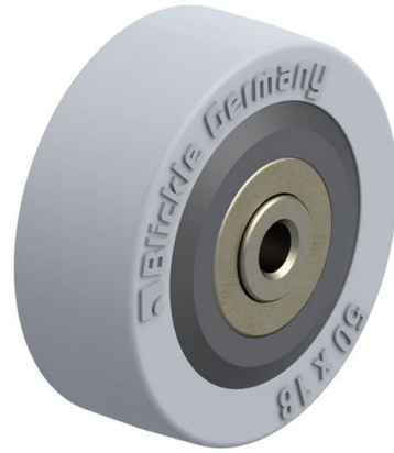
Roue utilisée VPA 50/6K