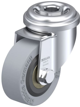
Roulette pivotante correspondante LRA-VPA 50K