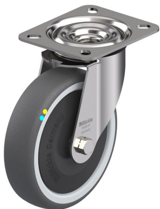
Roulette pivotante correspondante LEX-PATH 125KFD-ELS