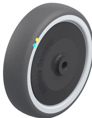
Roue utilisée PATH 125/8KFD-ELS