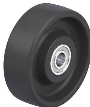
Roue utilisée POHI 150/20HXK