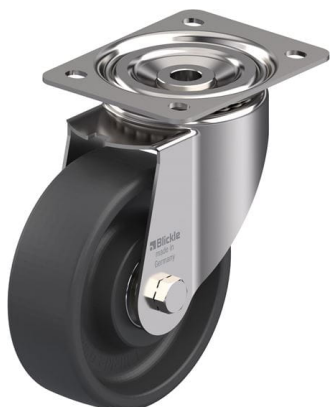
Roulette pivotante correspondante LIX-POHI 150HXK