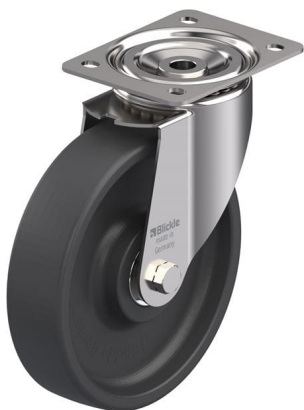
Roulette pivotante correspondante LIX-POHI 200HXK