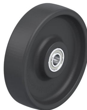
Roue utilisée POHI 200/20HXK