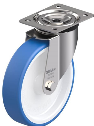
Roulette pivotante correspondante LX-POTHS 200G