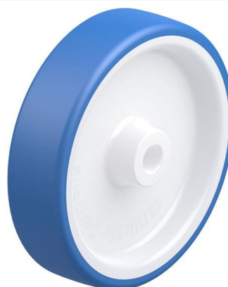
Roue utilisée POTHS 200/20G