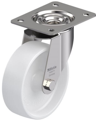
Roulette pivotante correspondante LEX-PO 150G