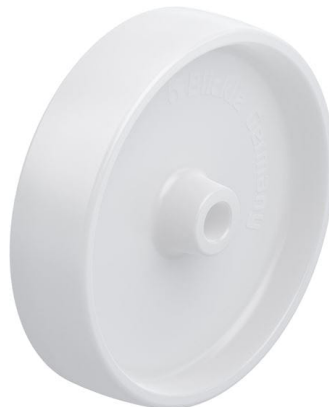
Roue utilisée PO 200/20G