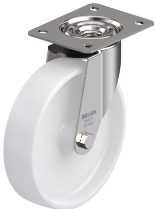
Roulette pivotante correspondante LEX-PO 200G