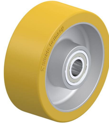
Roue utilisée ALTH 100/15K