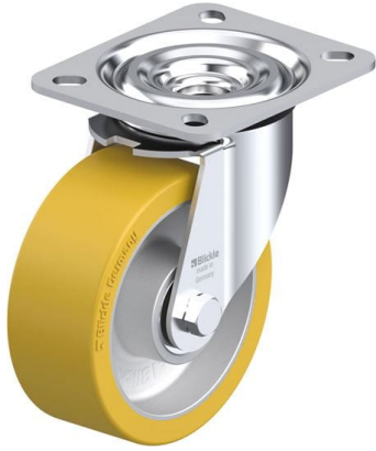
Roulette pivotante correspondante L-ALTH 100K