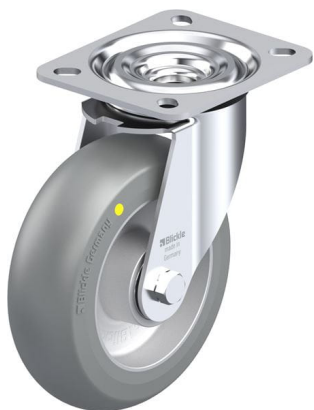
Roulette pivotante correspondante L-ALTH 125K-AS-CO