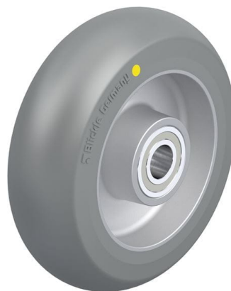
Roue utilisée ALTH 125/15K-AS-CO