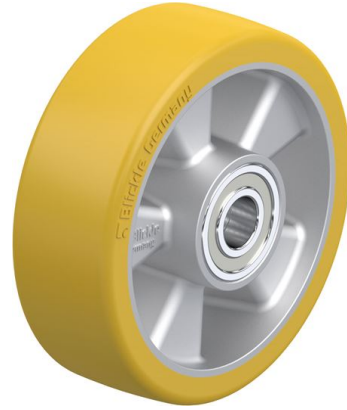
Roue utilisée ALTH 150/20K