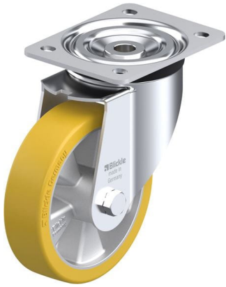
Roulette pivotante correspondante L-ALTH 151K