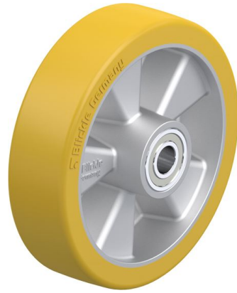
Roue utilisée ALTH 151/15K