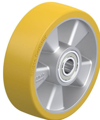
Roue utilisée ALTH 160/20K