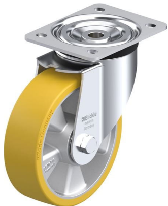
Roulette pivotante correspondante L-ALTH 160K