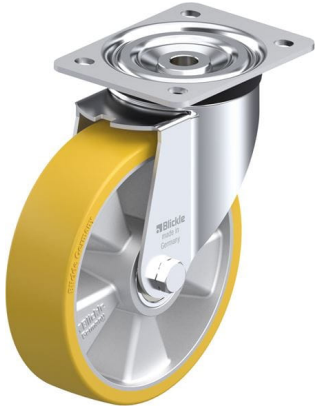
Roulette pivotante correspondante L-ALTH 180K