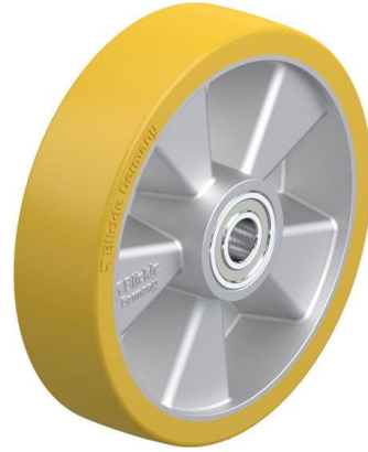
Roue utilisée ALTH 200/20K