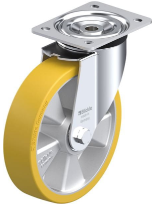
Roulette pivotante correspondante L-ALTH 200K