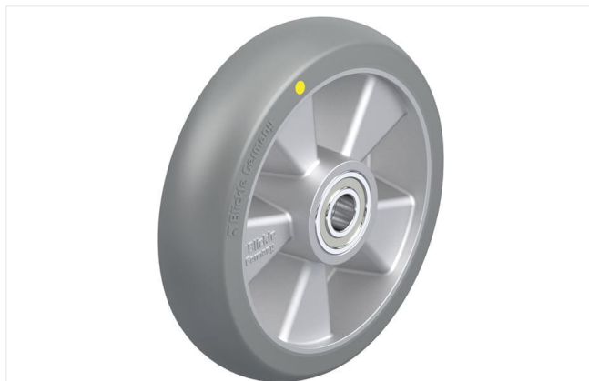
Roue utilisée ALTH 200/20K-AS-CO