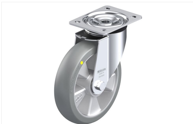
Roulette pivotante correspondante L-ALTH 200K-AS-CO