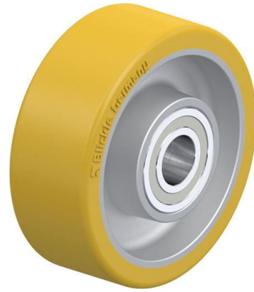
Roue utilisée ALTH 80/15K