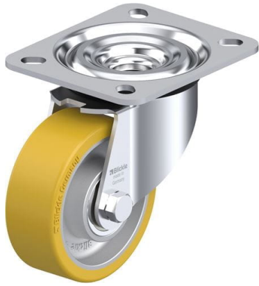
Roulette pivotante correspondante L-ALTH 80K