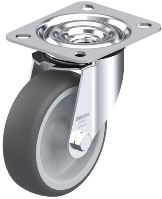
Roulette pivotante correspondante LE-PATH 100G