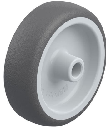
Roue utilisée PATH 100/12G