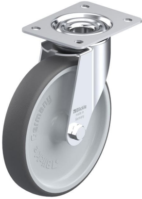
Roulette pivotante correspondante LE-PATH 200G