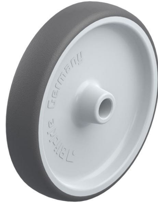
Roue utilisée PATH 200/20G