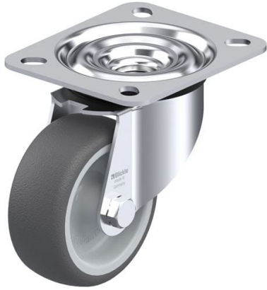
Roulette pivotante correspondante LE-PATH 80G