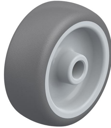
Roue utilisée PATH 80/12G