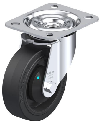
Roulette pivotante correspondante L-POEV 100KAD