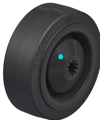
Roue utilisée POEV 100/8KAD