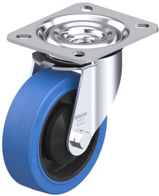
Roulette pivotante correspondante L-POEV 100KA-SB