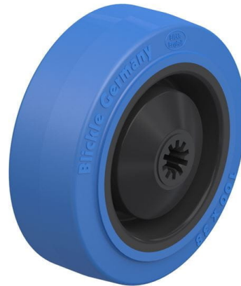
Roue utilisée POEV 100/8KA-SB