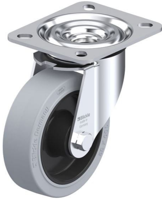
Roulette pivotante correspondante L-POEV 100XR-SG