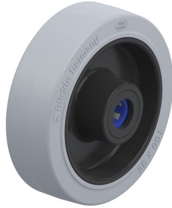
Roue utilisée POEV 100/12XR-SG