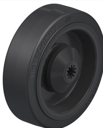
Roue utilisée POEV 125/8KA