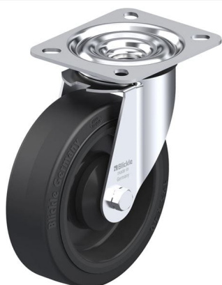
Roulette pivotante correspondante LE-POEV 125KA