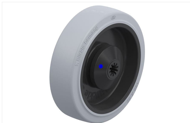
Roue utilisée POEV 125/8XKA-SG