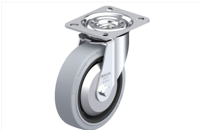
Roulette pivotante correspondante L-POEV 125XKA-SG-FA