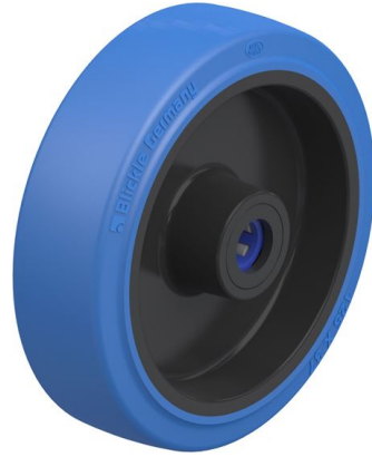
Roue utilisée POEV 125/12XR-SB