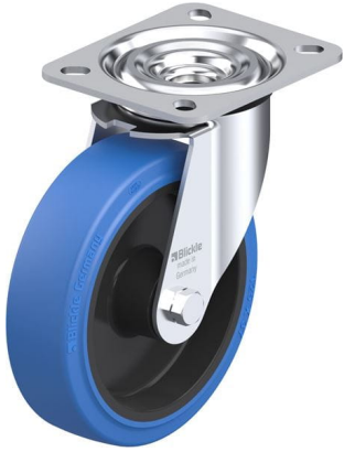
Roulette pivotante correspondante L-POEV 125XR-SB