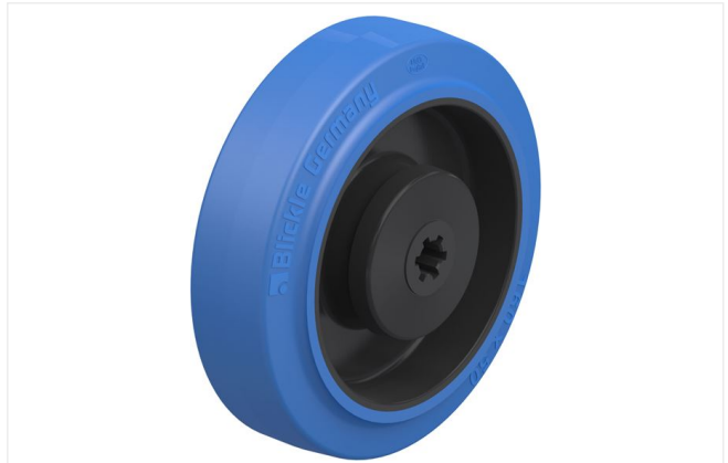
Roue utilisée POEV 160/12KA-SB