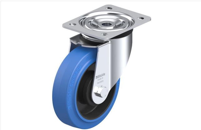
Roulette pivotante correspondante L-POEV 160KA-SB