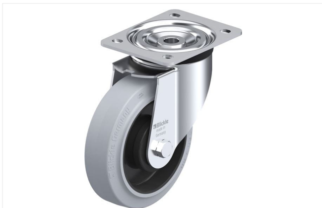
Roulette pivotante correspondante L-POEV 160KA-SG