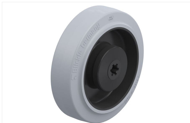
Roue utilisée POEV 160/12KA-SG