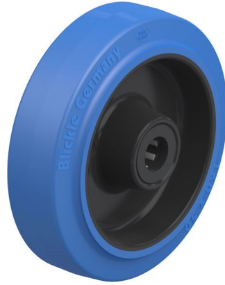
Roue utilisée POEV 160/20R-SB