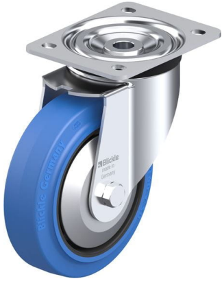
Roulette pivotante correspondante L-POEV 160R-SB-FA