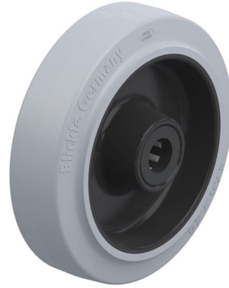
Roue utilisée POEV 160/20R-SG