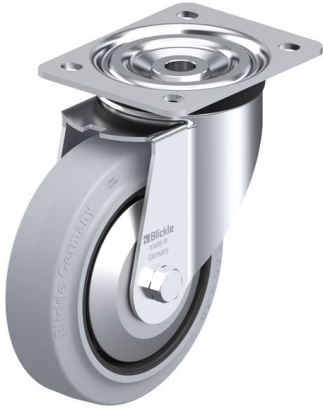
Roulette pivotante correspondante L-POEV 160R-SG-FA