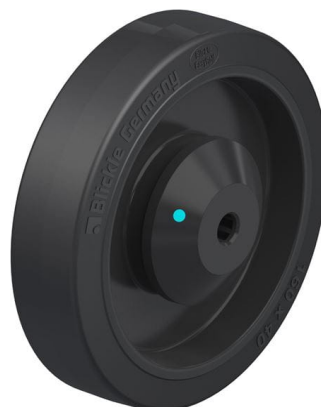
Roue utilisée POEV 161/12KAD