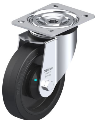
Roulette pivotante correspondante L-POEV 161KAD