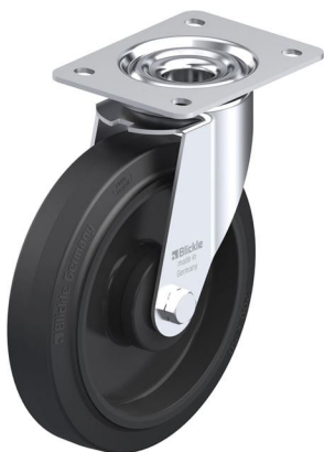
Roulette pivotante correspondante LE-POEV 200KA