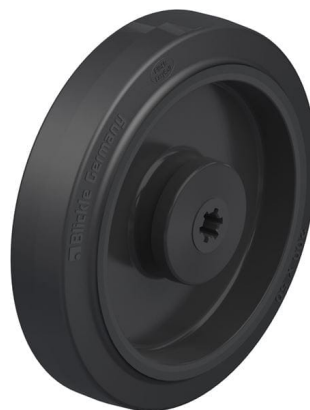
Roue utilisée POEV 200/12KA