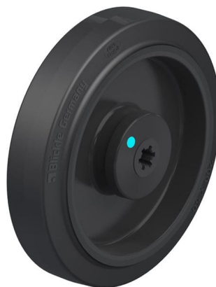
Roue utilisée POEV 200/12KAD