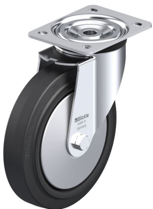
Roulette pivotante correspondante L-POEV 200KAD-FA