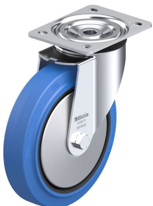
Roulette pivotante correspondante L-POEV 200KAD-SB-FA