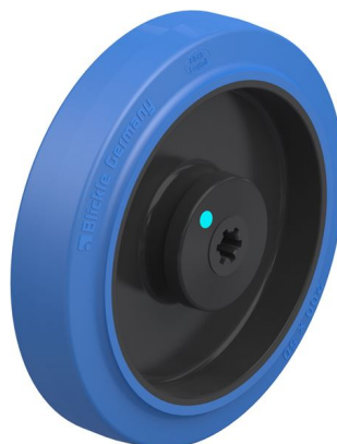
Roue utilisée POEV 200/12KAD-SB