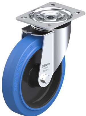
Roulette pivotante correspondante L-POEV 200XR-SB