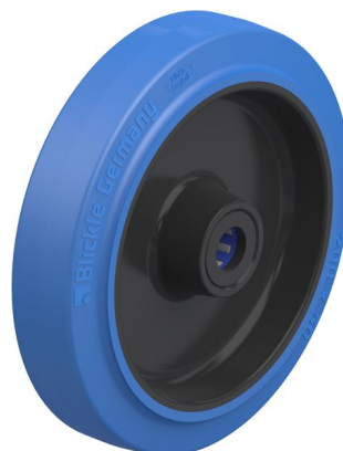
Roue utilisée POEV 200/20XR-SB