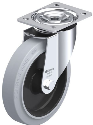
Roulette pivotante correspondante L-POEV 200XR-SG