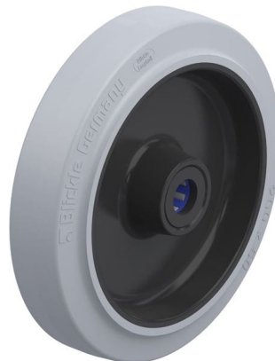
Roue utilisée POEV 200/20XR-SG