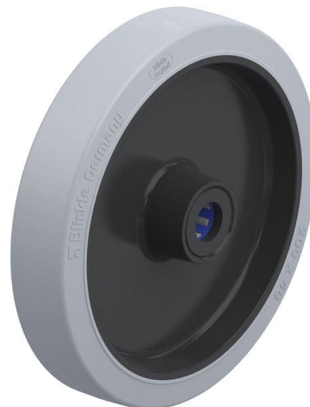
Roue utilisée POEV 201/20XR-SG