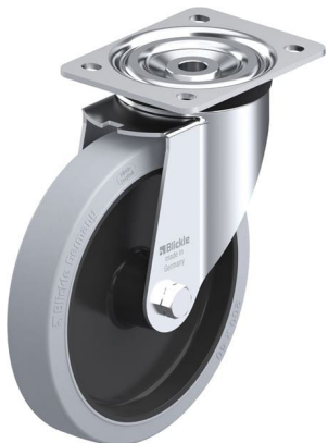
Roulette pivotante correspondante L-POEV 201XR-SG