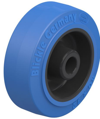
Roue utilisée POEV 80/12G-SB