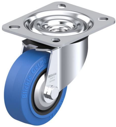
Roulette pivotante correspondante L-POEV 80G-SB-FA