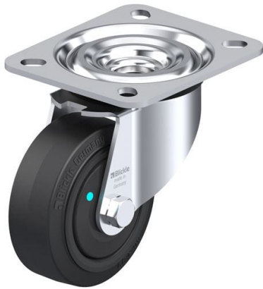
Roulette pivotante correspondante L-POEV 80KFD