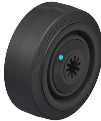
Roue utilisée POEV 80/8KFD