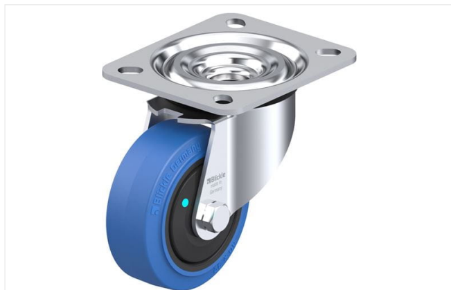
Roulette pivotante correspondante L-POEV 80KFD-SB