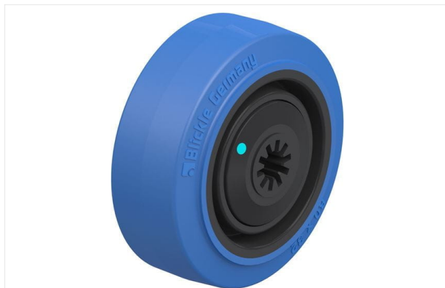
Roue utilisée POEV 80/8KFD-SB